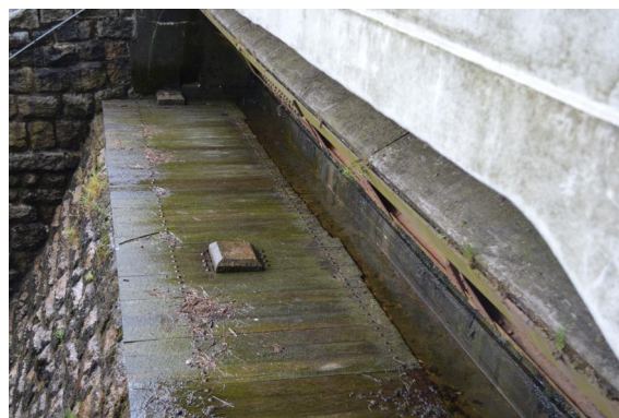
FOTO č.17: MVE II stávající opláštění kaskády dř. obkladem v horní části klapky